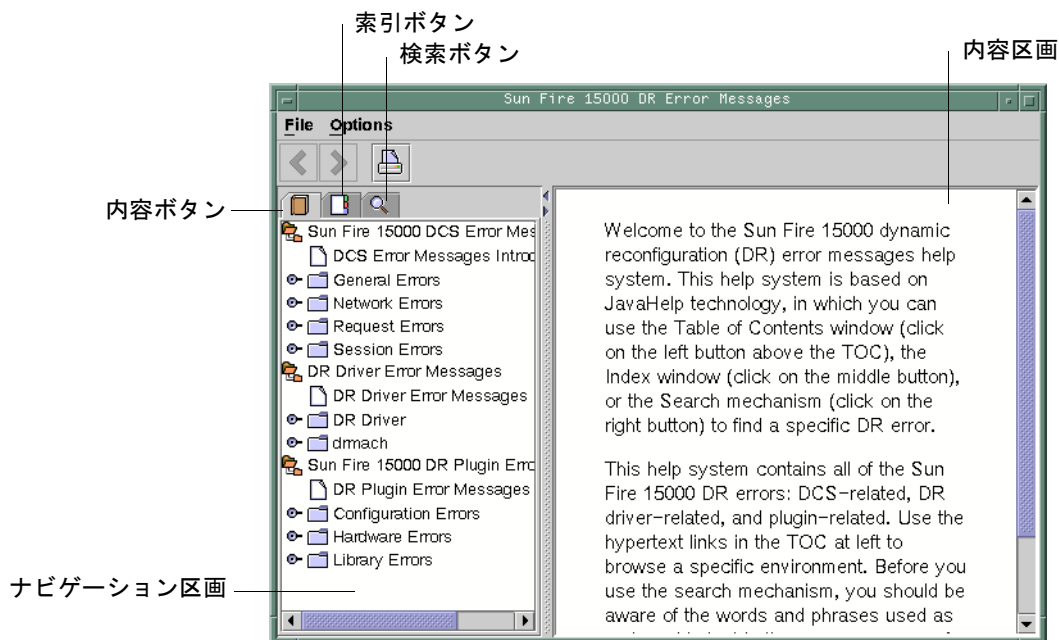
図 3-1 hsviewer GUI コンポーネント

標準的な JavaHelp システムビューア hsviewer によって、DR エラーメッセージヘルプシステムが表示されます。このビューアは、図 3-1 に示すように、ツールバーと 2 つの区画 (内容区画とナビゲーション区画) からなります。